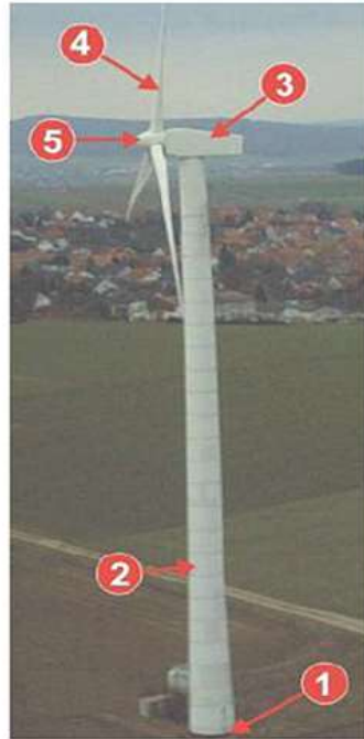
Ilustración de torre eólica