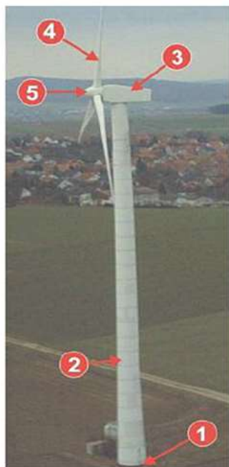
Ilustración de torre eólica

10. Indicaron que no forman parte del producto objeto de investigación el aerogenerador, nacelle (caja que acoge la multiplicadora, el generador eléctrico y los sistemas de control, orientación y freno) y las palas del rotor, independientemente de si están o no unidas a la torre de viento, así como los componentes internos o externos que no están unidos a las torres de viento o secciones de las mismas.